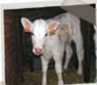
la ferme de Béa

Ma soeur adore aller voir chaque soir les petits yeaux qui têtent leur maman. Ils sont mignons avec de grands yeux tout doux.